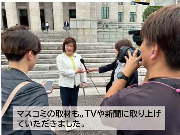
マスコミの取材も。TVや新聞に取り上げていただきました。